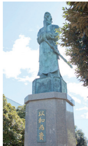
大前キャンパス内にある聖徳太子像